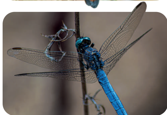
GRAFICA - ROSARNO (RC)

regno degli uccelli limicoli , come il Piro piro, il Piovanello e il Cavaliere d'Italia, che si muovono con eleganza lungo la battigia.